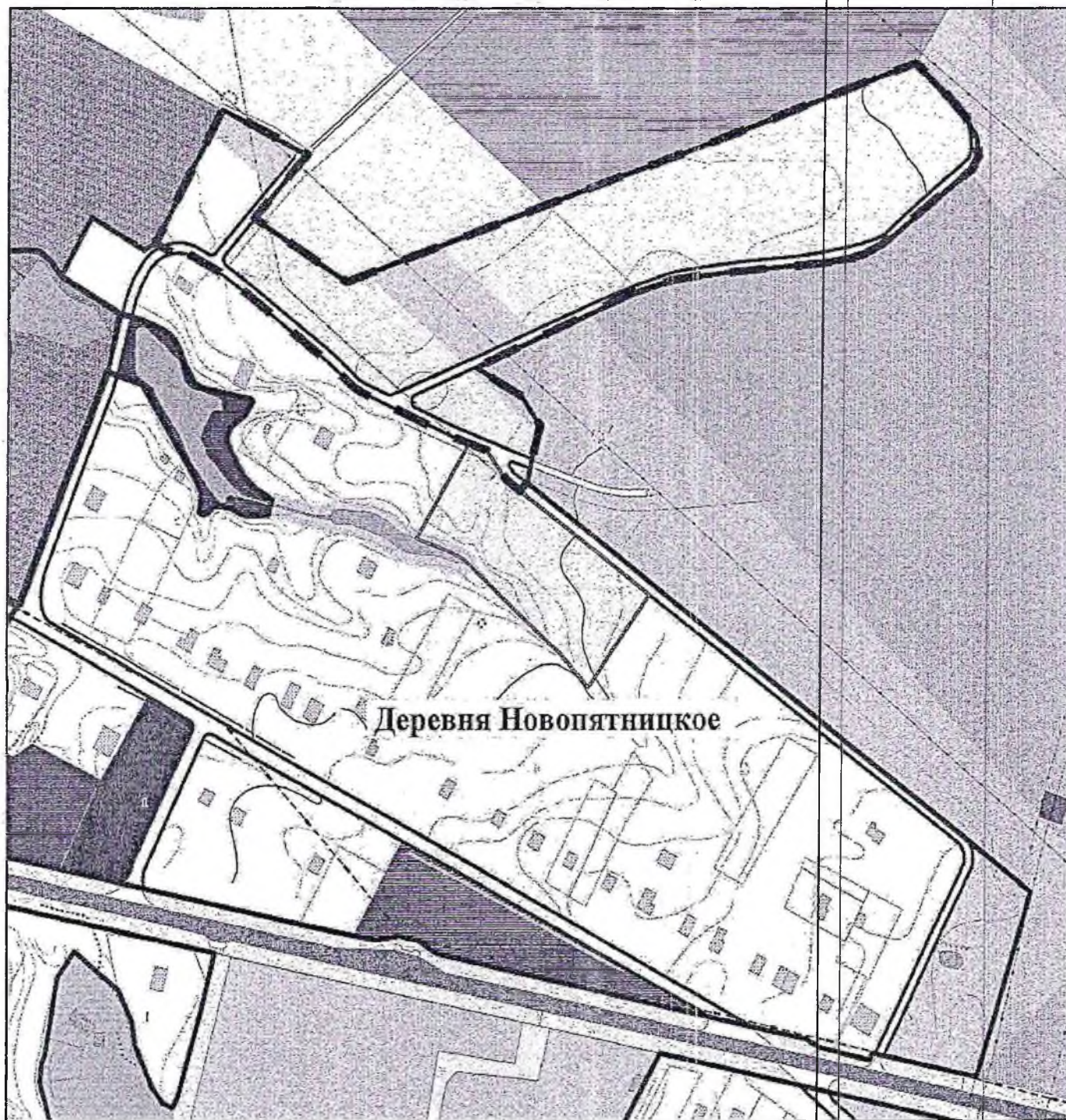
Схема границ территории проектирования